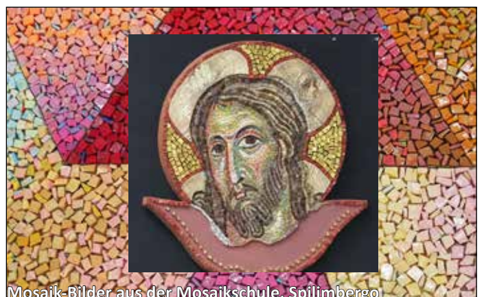
Mosaik-Bilder aus der Mosaikschule, Spillimbergo