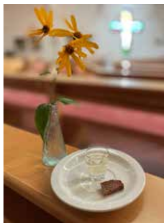
Bild: Abendmahl in Villach Nord